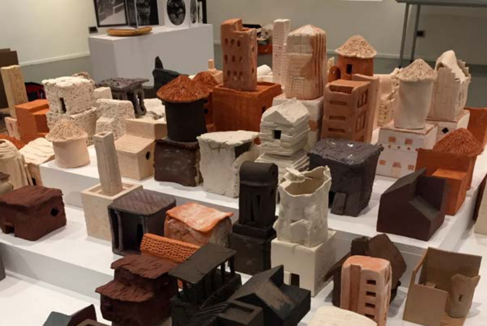
Exposition à la médiathèque, atelier céramique