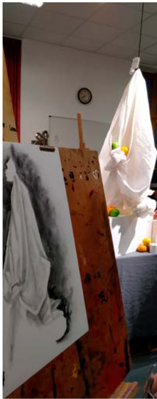
Nature morte, atelier dessins & dessins - Virginie Mathé

En explorant le lien nature et paysage dans tous ces aspects, les élèves s'initieront à des approches plastiques différentes (dessin, peinture, volume, installation) pour exprimer leur sensibilité et leur créativité.