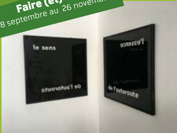
Insert entrecroisé 2020