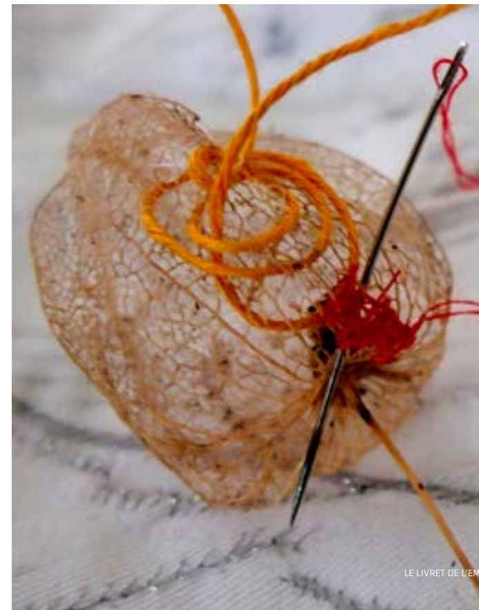
Atelier textile, Kristina Depaulis

Initiation aux différentes expressions de la création textile, les propositions de travail au sein de l'atelier croiseront parfois les techniques (du textile au papier, à la photo, à la céramique, au paysage...), afin de pousser les intuitions de chacun dans des espaces inexplorés de soi.