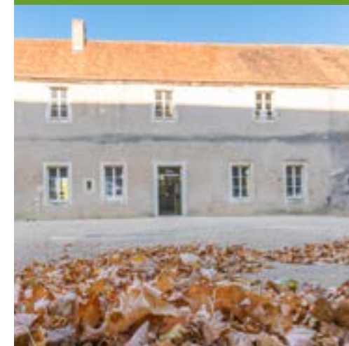
Façade des ateliers Espace Pierre-Duplessy Courvent des Cordeliers