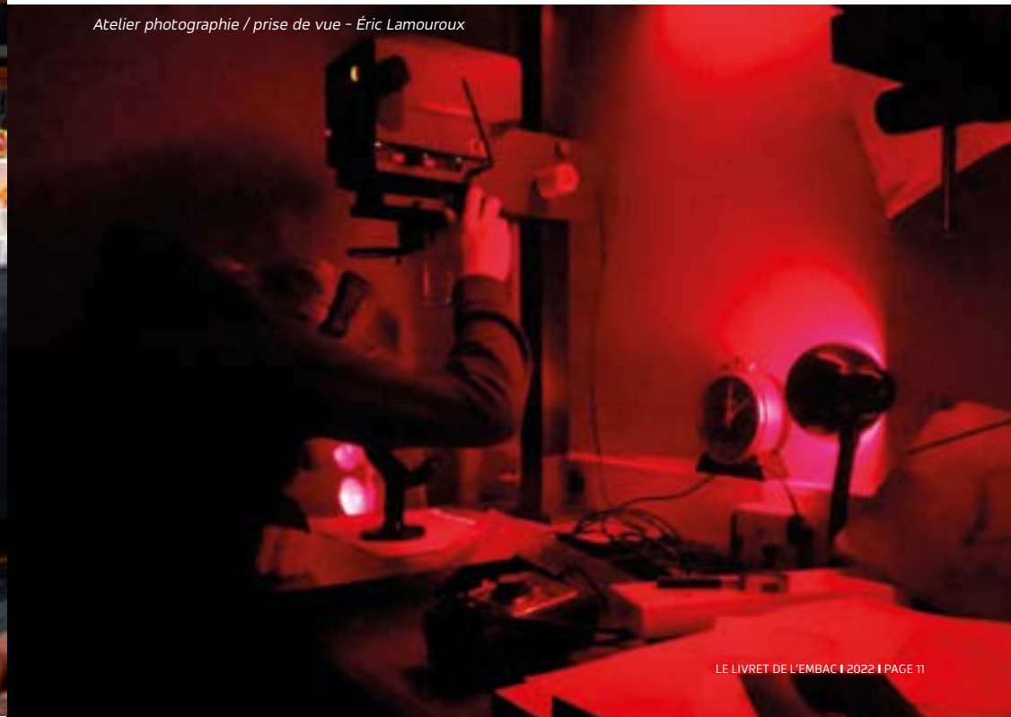
Atelier photographie / prise de vue - Éric Lamouroux

Dans un contexte qui ne tient pas compte du clivage argentique-numérique : prises de vues (cadrage, composition, éclairage), sorties en extérieur, travail au laboratoire (développement et tirage, pratiques alternatives), expérimentations diverses sont autant de moyens proposés afin d'acquérir les savoirs et les techniques nécessaires à l'élaboration d'une production et d'un langage inscrits dans le cadre d'une approche plasticienne de la photographie.